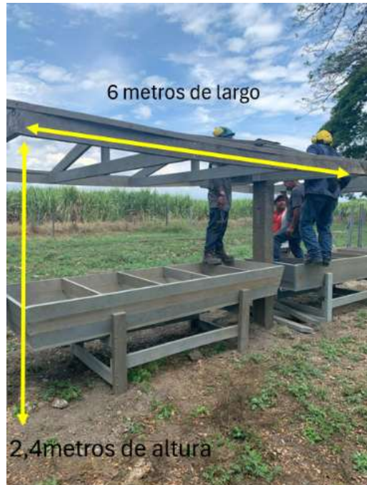
Imagen 7 Ubicación proyectada en potrero