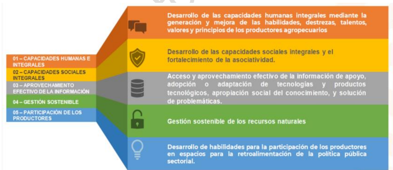
Figura 1. Aspectos del enfoque de Extensión Agropecuaria.

Esta ley busca garantizar una visión integral y sostenible en la prestación del servicio de extensión agropecuaria, promoviendo el desarrollo humano, la colaboración entre actores, el uso efectivo de la tecnología y la participación significativa de la comunidad agrícola en la toma de decisiones del sector (Figura 1).