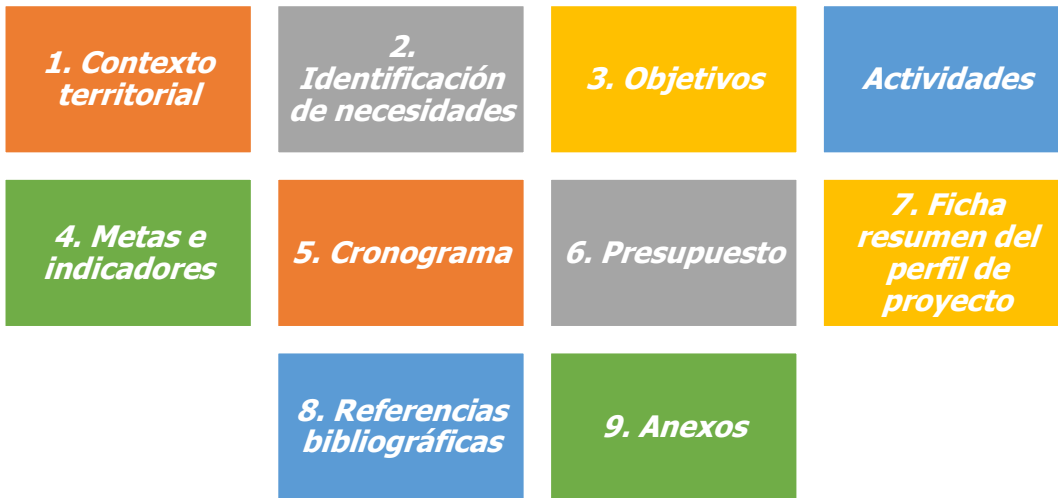
Figura 1. Estructura de los proyectos de Extensión Agropecuaria.