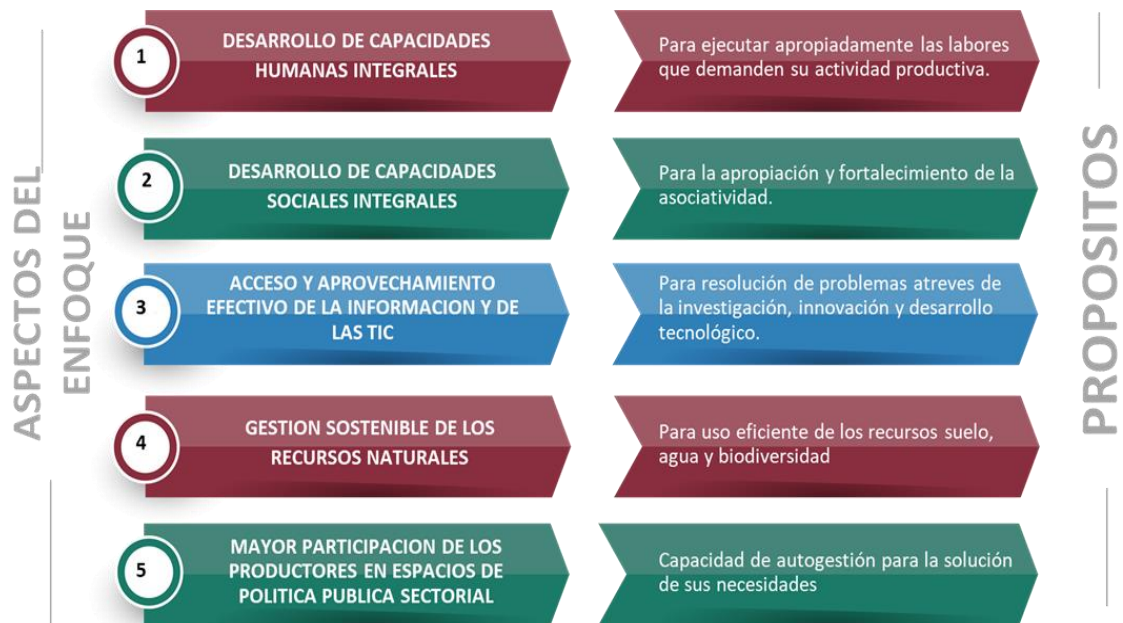
Figura 2. Aspectos del enfoque de Extensión Agropecuaria (Ley 1876 de 2017).