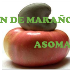
TABLA DE CALIFICACION: