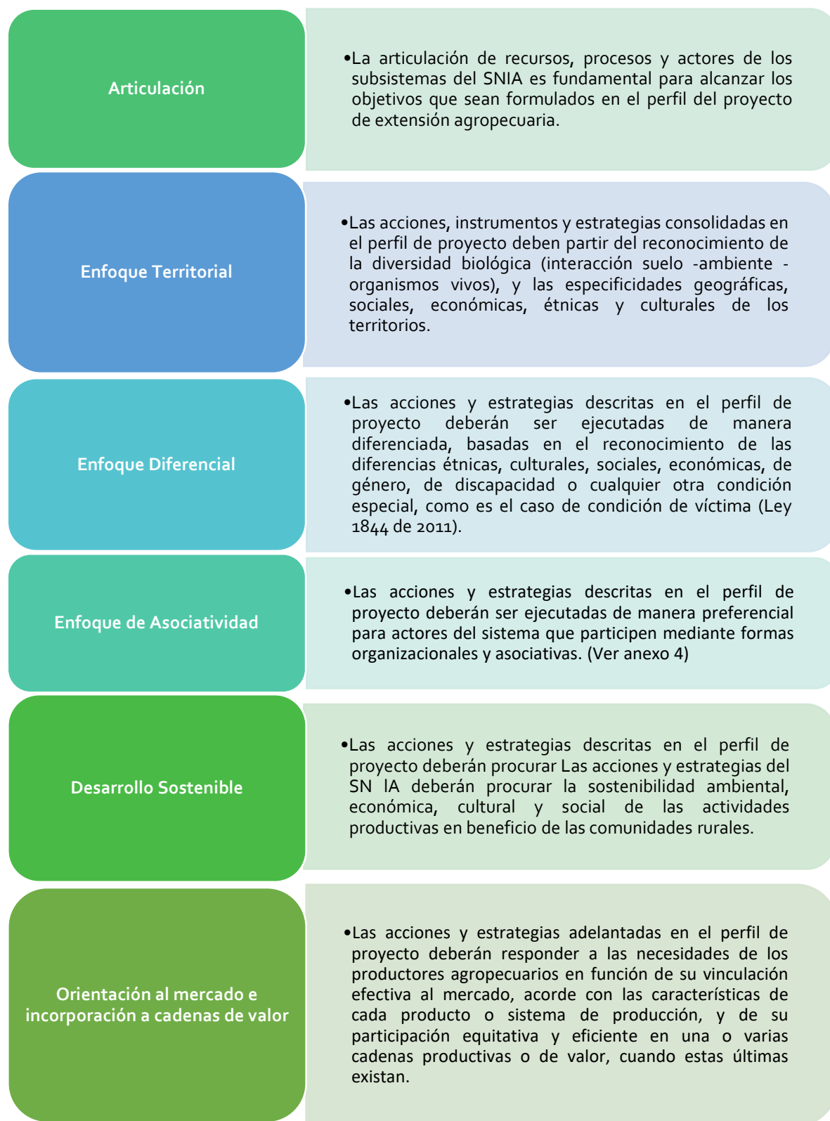
Figura 1. La extensión agropecuaria en perspectiva de principios del SNIA

La elaboración de los perfiles de proyecto de extensión agropecuaria pasa por la comprensión y aplicación de los siguientes Principios, establecidos en el Artículo 3 de Ley 1876 de 2017: