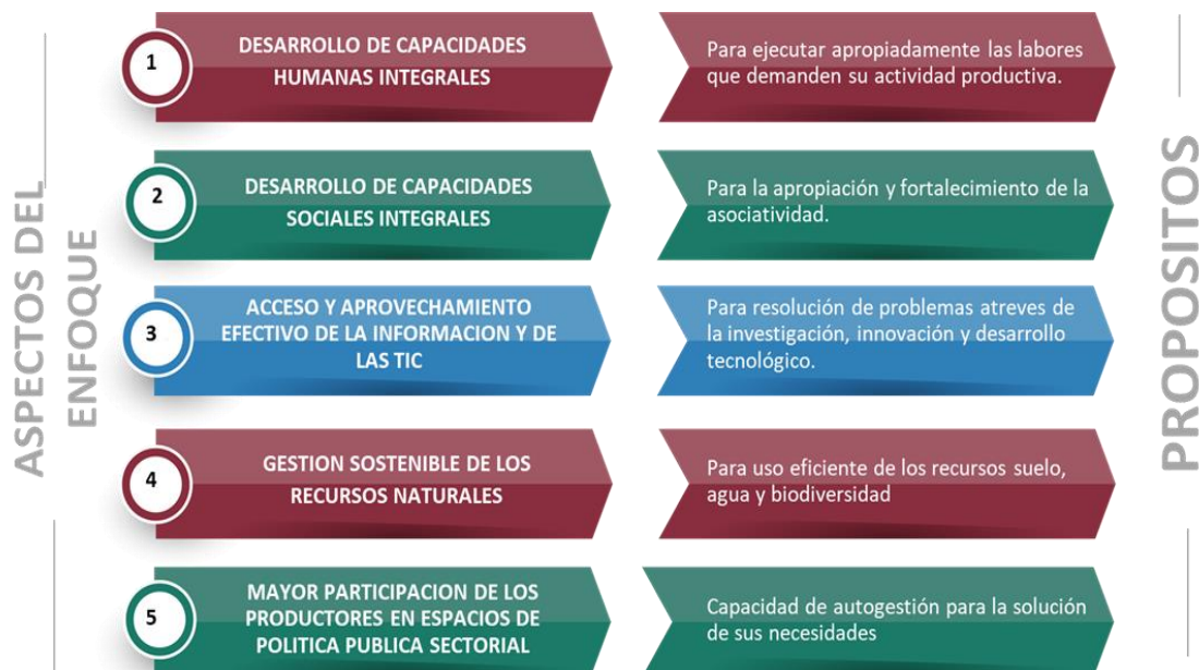
Figura 3. Aspectos del Enfoque del SPEA

Las problemáticas deben identificarse a partir de: