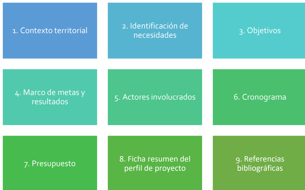
Figura 2. Estructura del perfil de proyecto de extensión agropecuaria

La estructura del perfil del proyecto de extensión se compone de los siguientes apartados: