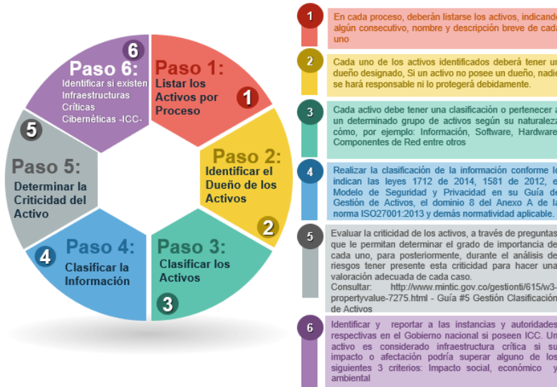
Ilustración 2. Pasos para la identificación y valoración de activos