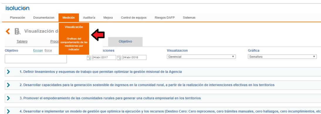
Gráfica N° 2: Consulta de indicadores en isolución

Al dar clic a un indicador, es posible conocer el detalle del reporte junto con las evidencias aportadas por los responsables.