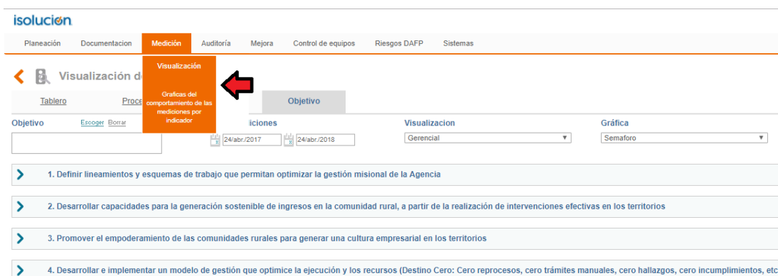
Gráfica N° 2: Consulta de indicadores en isolución

Al dar clic a un indicador, es posible conocer el detalle del reporte junto con las evidencias aportadas por los responsables.